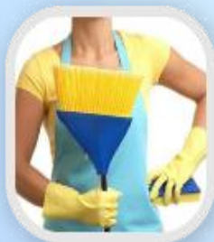
Влажная уборка помещения