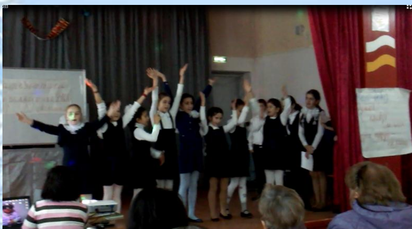
Ученики рассказывали стихи, исполняли песни.