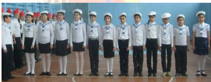
Экипаж 4 «а» «Юнги» на плацу. Ну, посмотрим как шагают Новички – морячки, Ровный шаг, спина прямая, Четкий взмах руки.

Показали отличную выpravку и выполнение команд.