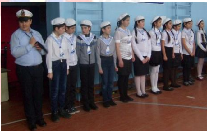
Свою боевую выpravку показал экипаж «Дружба» 5 «а» класса.