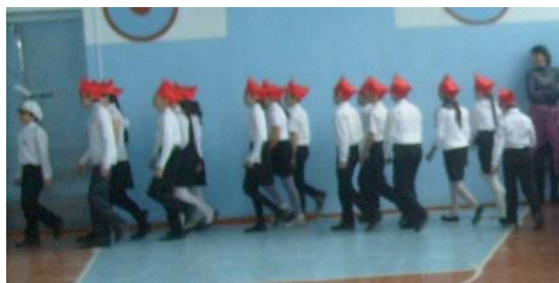
Затем экипаж 5 «б» класса «Отважный» : «Пятиклассники, вперед! Впереди победа ждет! Будем Родине верны И чтоб не случилось войны!!!» показал свою выpravку.