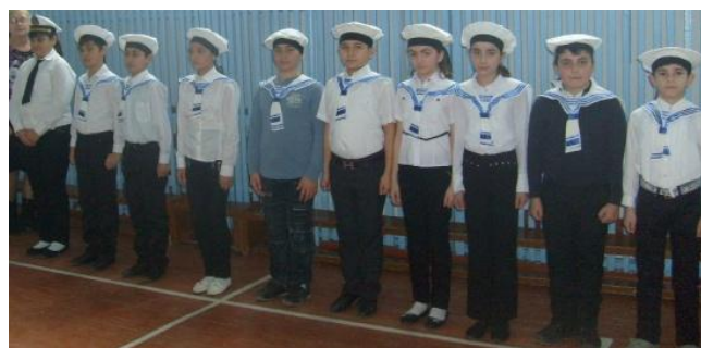
«Над кораблем алеет наше знамя, А за кормой лазурная волна! Четвероклассники подрастут и станут морячками, Защитой станут тебе, страна!» Экипаж 4 «б» класса «Алые паруса» справился немного хуже.

Показали отличную выpravку и выполнение команд.