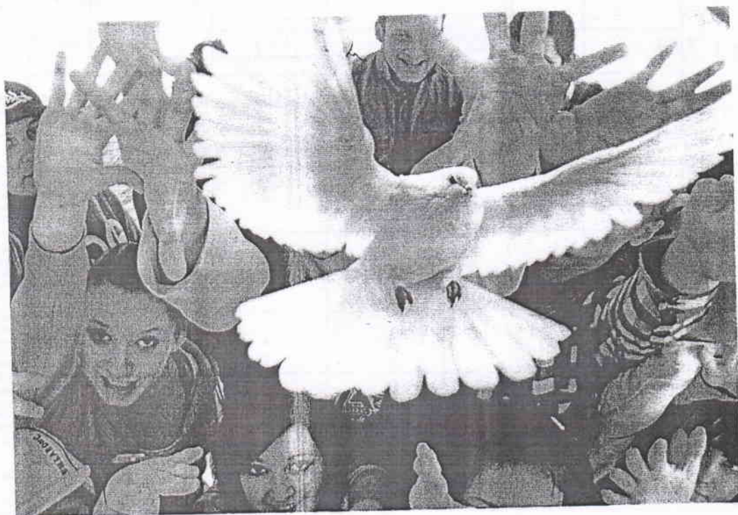
г. Моздок, 2020 г.

Будущее мира за новыми поколениями. Так давайте сделаем, чтоб этот мир был полон тепла и любви. Это отчасти в наших руках! В руках каждого!