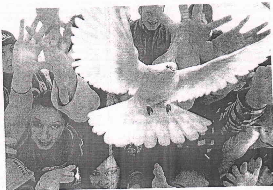
г. Моздок, 2020 г.

Будущее мира за новыми поколениями. Так давайте сделаем, чтоб этот мир был полон тепла и любви. Это отчасти в наших руках! В руках каждого!