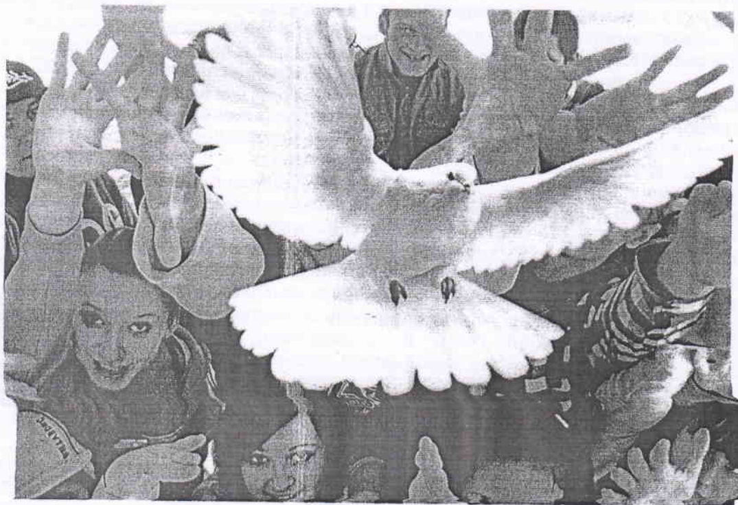
г. Моздок, 2020 г.

Будущее мира за новыми поколениями. Так давайте сделаем, чтоб этот мир был полон тепла и любви. Это отчасти в наших руках! В руках каждого!